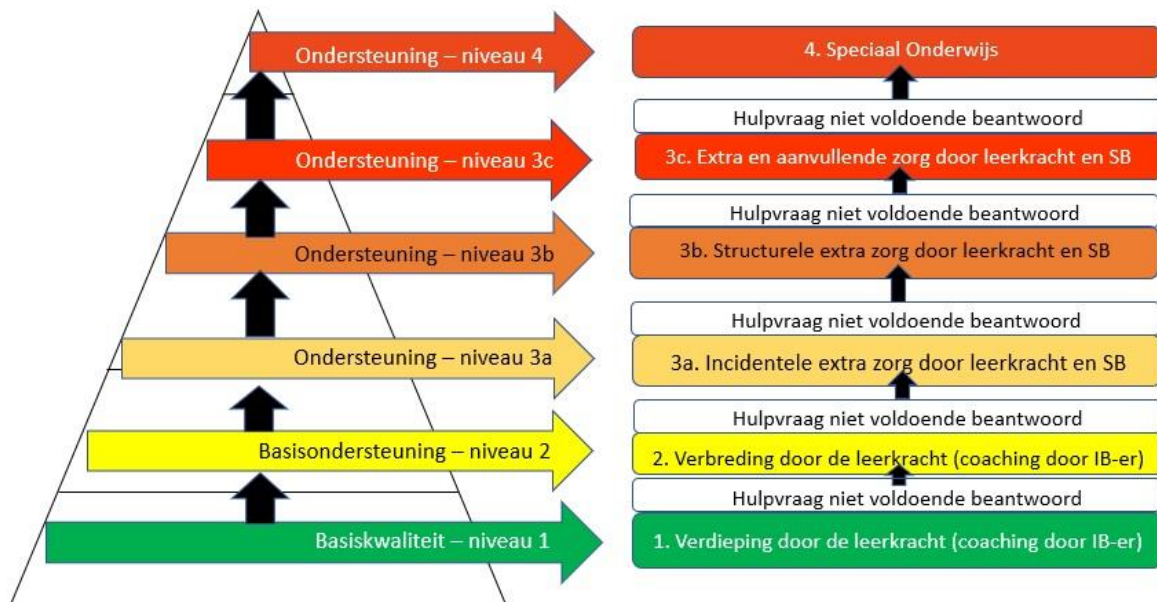
Figuur 3: Ondersteuningspiramide SKOBOS

In zijn algemeenheid kan hierbij gezegd worden dat hierdoor dit beleidsstuk begaafdheid ook ingedeeld kan worden volgens de Piramide van Zorg, opgesteld door het samenwerkingsverband PO de Kempen, waar SKOBOS bij aangesloten is. Hierdoor kan er onderscheid gemaakt worden tussen basis- en extra ondersteuning. Dit betekent voor de scholen het volgende: